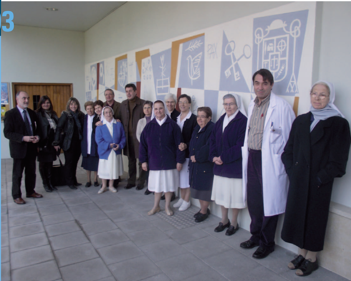
Un dels murals de l'entrada de la Clínica Salus Infirmorum amb representants de la Clínica i l'alcalde de Banyoles

Les teves sardanes ens mantindran el teu record viu.