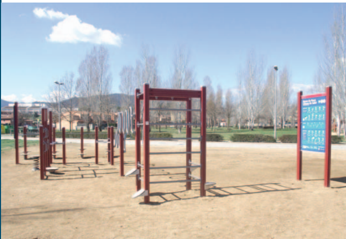
El nou parc de salut del parc Manel Saderra

Aquests tres parcs de salut, impulsats per Dipsalut i l'Ajuntament, orientats per a persones grans s'han distribuït per la ciutat: al parc Manel Saderra, al parc de Can Cisó i al parc de la Draga. Fer exercici amb els peus o fer passar una anella sense tocar un circuit corbat són alguns dels exercicis que els banyolins i banyolines podran practicar.