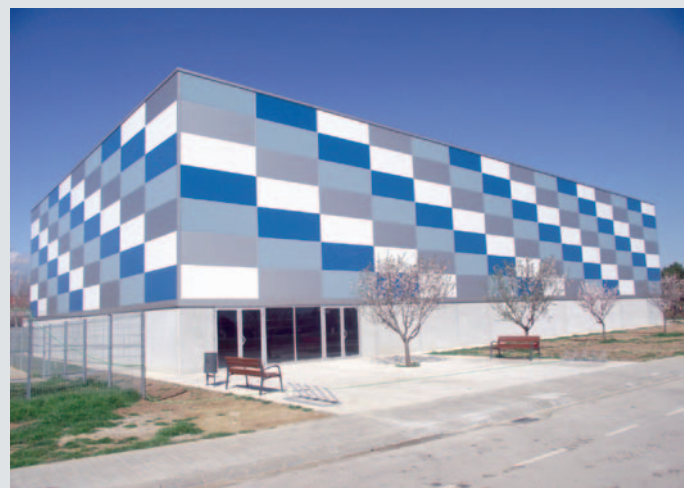
El nou pavelló del CEIP Pla de l'Ametller

El pavelló té una doble funcionalitat, de 9 del matí a les 5 de la tarda per l'escola, principalment com a gimnàs de l'escola, però de 5 de la tarda a les 9 del vespre per a activitats extraescolars de la pròpia escola o per a clubs de la ciutat. També el podran usar els veïns del barri, entitats culturals i en general tots els banyolins i banyolines. És a dir, tindrà un ús polivalent i no només esportiu.