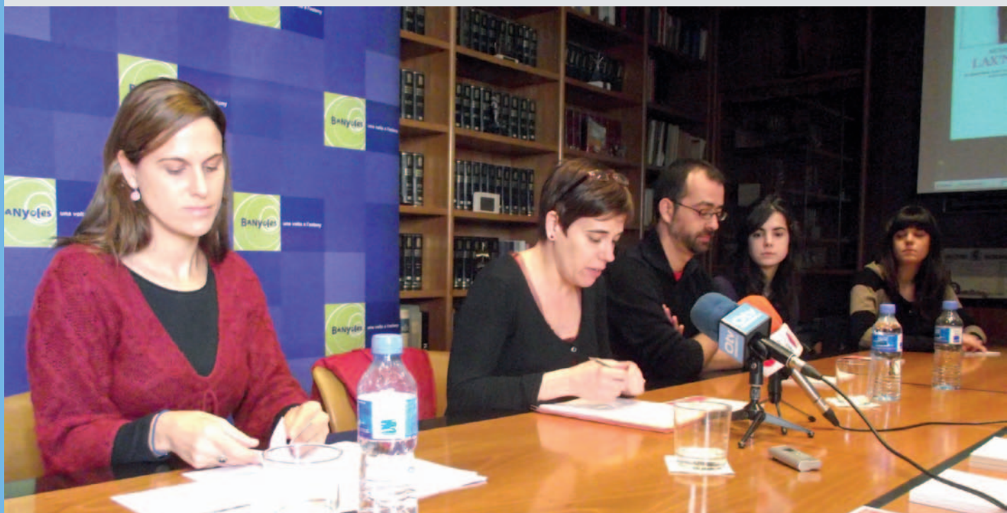
Una programació estable del Teatre Municipal variada i de qualitat

I un dels papers més destacats de la programació és per a les companyies banyolines. Hi ha ni més ni