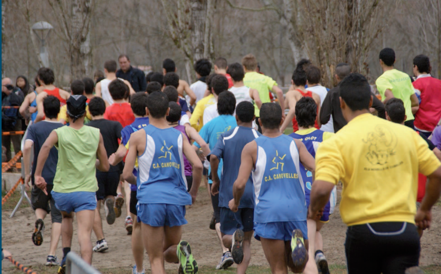
Multitudinària Final nacional de cros, a Banyoles