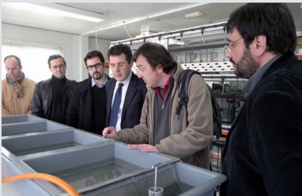
Interior del nou laboratori de cria de nàiades

L'objectiu es posar en marxa el laboratori, és a dir, crear les instal·lacions per al manteniment de peixos hostes i d'exemplars adults de nàiade allargada ( Unio elongatulus ) durant la seva fase fèrtil, i assajar les tècniques i mètodes de cria en captivitat per a l'obtenció de juvenils, per finalment alliberar-los a l'Estany. El laboratori s'ha construït a la finca de Casa Nostra, en una parcel·la cedida per la Institució Magdalena Aulina.