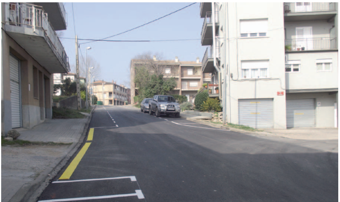
El carrer Remei amb el nou reasfaltatge

Des del 2008 s'han reasfaltat molts dels carrers de la ciutat entre els quals els dos eixos principals de Banyoles, el carrer Llibertat, l'avinguda Països Catalans i el passeig mossèn Lluís Constans.