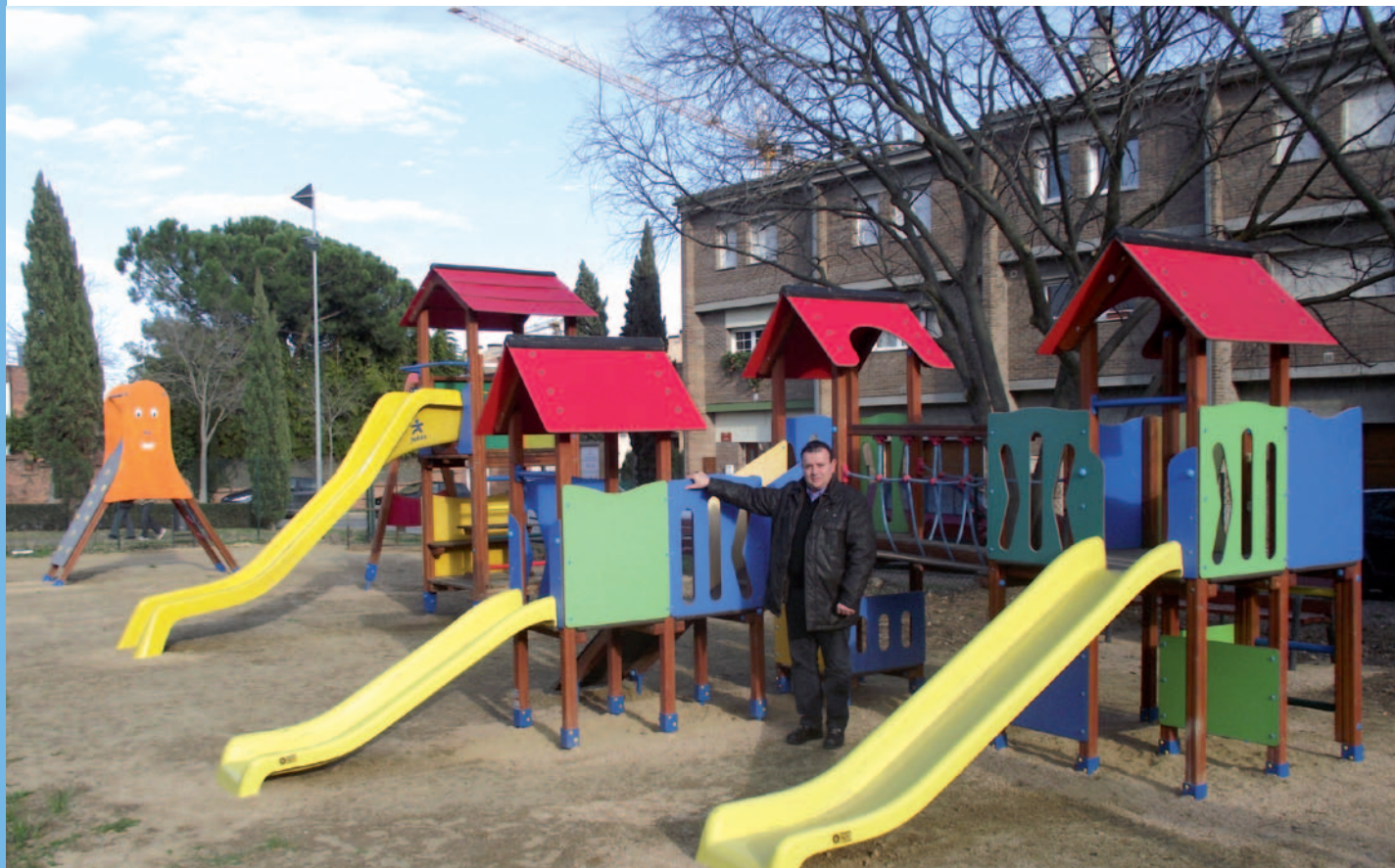
El nou parc de Can Cisó de Guèmol

uns mesos del carrer Pare Claret. Concretament, són una molla, un gronxador i un parell d'estructures. Així doncs, no s'ha comprat cap joc nou. Per acabar de millorar l'espai s'ha instal·lat una tanca per separar el parc de Can Cisó i s'ha millorat la il·luminació al parc. Per altra banda, també hi ha un dels 3 nous parcs de salut.