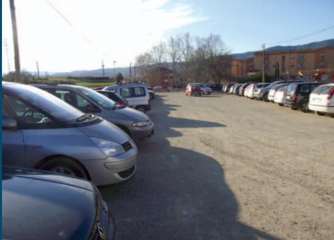
El nou pàrquing de Canaleta ple de gom a gom