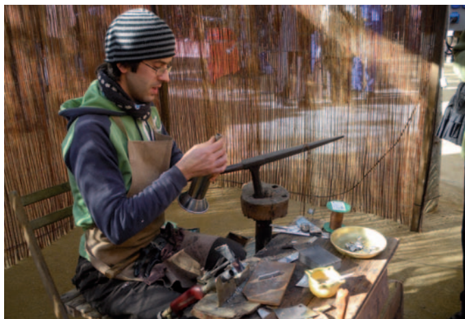
Un artesà durant la III Fira de Nadal i Mostra d'oficis artesans de Banyoles

Es va programar els dies 11 i 12 de desembre, a la plaça Major. La Fira de Nadal va comptar amb unes 50 parades de diferents articles com ara alimentació (pa, pastissos, formatges, embotits, vi, castanyes, dolços...), decoració