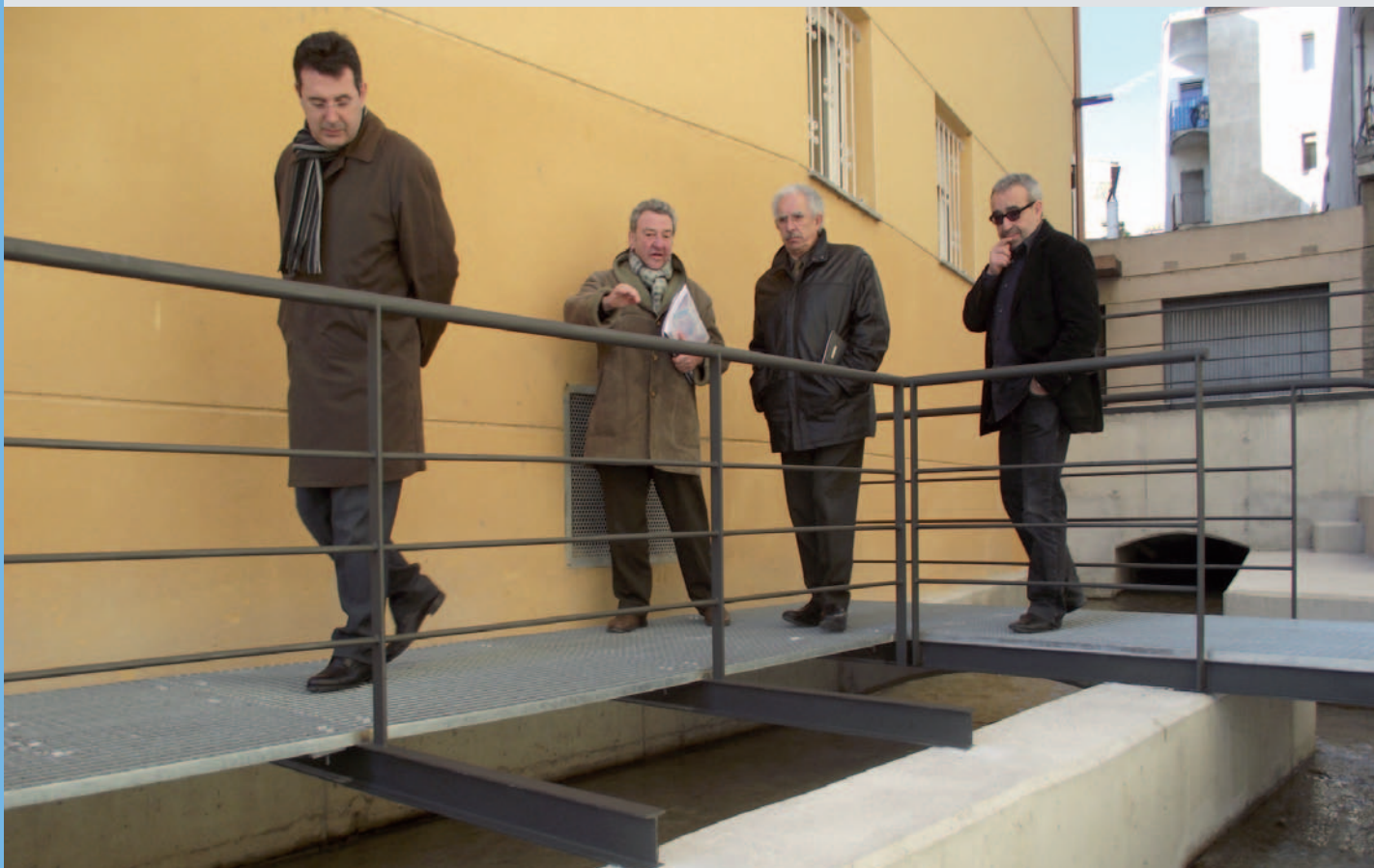
Les obres acabades de la recuperació d'un tram del rec Major

És una zona delimitada per pisos a cada costat i que s'ha condicionat com a espai per a vianants amb el rec al descobert tot combinant el formigó i el travertí. En aquest tram hi havia el molí de Can Pujol i el projecte recupera el traçat per on passava el rec Major quan hi havia el molí, amb el lloc de pas principal i el de desguàs. A més, s'ha recuperat el salt d'aigua d'uns 3 metres, s'ha construït una plataforma per acostar-se al salt d'aigua i una passera per mirar el rec Major i el salt. A més, aquesta obra millora la comunicació a peu per la ciutat. El cost de l'obra és d'uns 285.000 euros i s'ha finançat gràcies el Fons Estatal per a l'Ocupació i la Sostenibilitat Local.