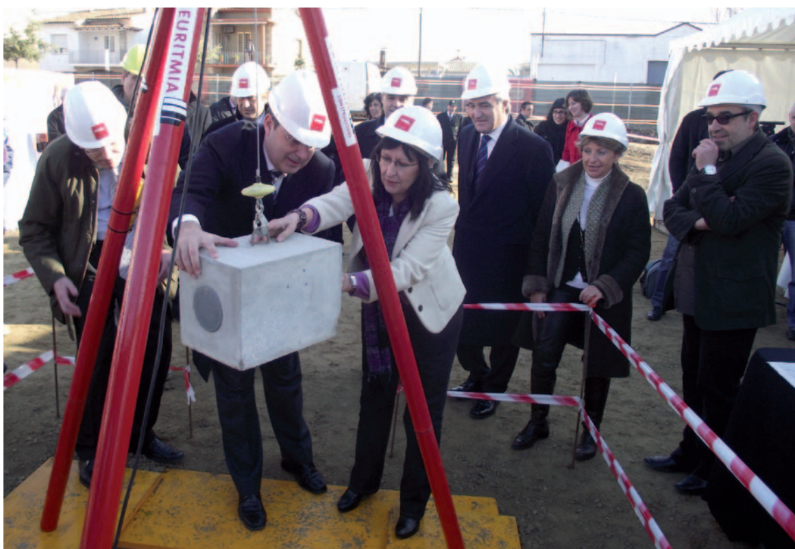
La primera pedra de la promoció d'habitatges de lloguer assequible

Com a la resta de promocions del programa d'Habitatge Assequible, la promoció de l'Obra Social "la Caixa" a Banyoles es construirà segons uns criteris i unes tecnologies respectuoses amb el medi ambient i amb la intenció de facilitar l'accessibilitat de les persones amb mobilitat reduïda. Els contractes d'arrendament seran per un període inicial de 5 anys, renovables en el cas de seguir complint amb els requisits de la normativa de protecció oficial.